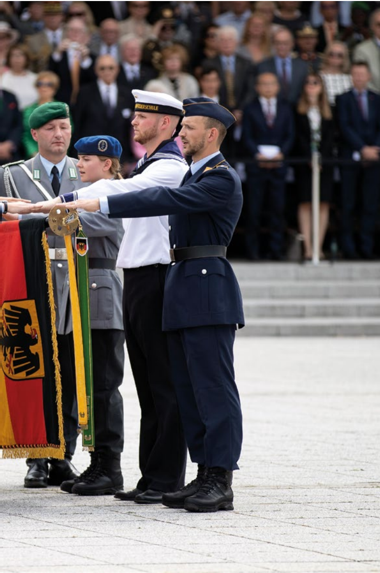
Rekrutinnen und Rekruten der Bundeswehr legen ihr Gelöbnis ab.

Mitgliedschaft in EU und NATO, unserem auf sozialer Marktwirtschaft und internationaler Verflechtung basierendem Wirtschaftsmodell und der Verantwortung für unsere natürlichen Lebensgrundlagen. Auf dem festen Fundament unserer Werte bestimmen wir diese Interessen: