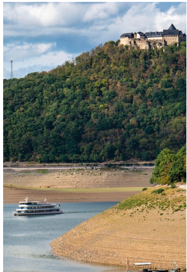
Die Folgen der Klimakrise wurden für Menschen und Natur besonders in den letzten Jahren weltweit deutlich spürbar – auch in Deutschland.