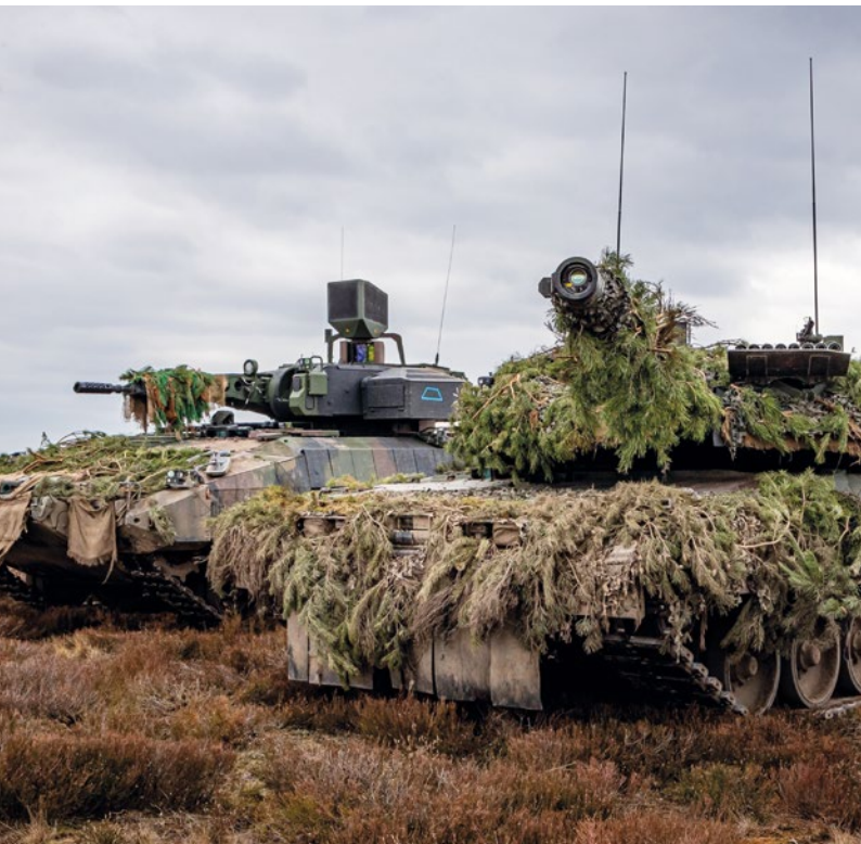
Schützenpanzer Puma und Kampfpanzer Leopard der Bundeswehr

Glaubwürdige Abschreckungs- und Verteidigungsfähigkeit im transatlantischen Bündnis der NATO ist das unverzichtbare Fundament deutscher, europäischer und transatlantischer Sicherheit. Die NATO ist oberste Garantin für den Schutz vor militärischen Bedrohungen. Sie verbindet Europa politisch mit Nordamerika. Zweck des Bündnisses ist es, die Menschen im Bündnisgebiet zu schützen und unsere Sicherheit, unsere Werte und unsere demokratische Lebensweise zu verteidigen. Wir stehen unverbrüchlich zum Versprechen auf gegenseitigen Beistand nach Artikel 5 des Nordatlantikvertrags. Unser Bekenntnis zur NATO und zu unseren Verpflichtungen im Bündnis ist unverrückbar. Dies gilt ebenso für unser Bekenntnis zur EU-Beistandsklausel aus Artikel 42, Absatz 7 des Vertrags über die Europäische Union, sowie unsere gegenseitige Beistandspflicht mit Frankreich aus Artikel 4 des Vertrags von Aachen.