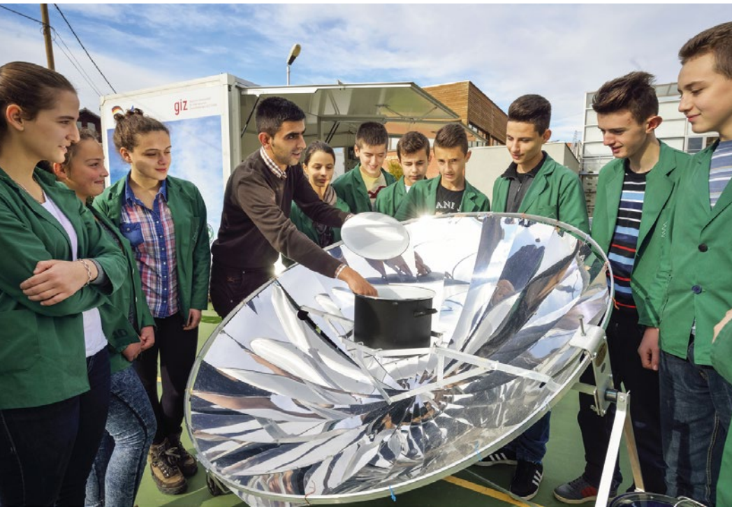
Schülerinnen und Schüler in Pristina lernen, mit Solartechnik der Klimakrise zu begegnen.

Die globale Krise unserer Lebensgrundlagen erfordert eine Antwort, an der sich alle Staaten beteiligen. Ziel der Bundesregierung ist es deshalb, globale und ambitionierte Lösungen zu finden. Dies schließt den Dialog mit allen relevanten Akteuren ein. Technologieoffenheit ermöglicht dabei Handlungsfreiheit für uns und kommende Generationen.