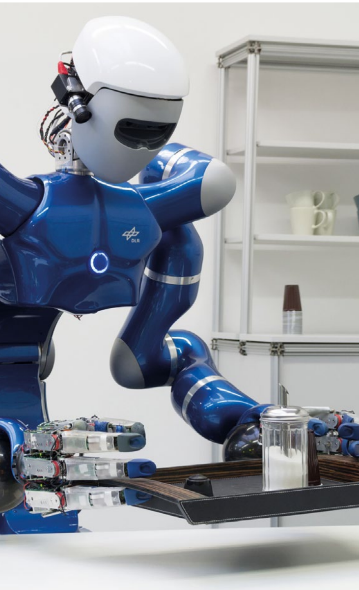
Die Bundesregierung fördert gezielt Forschung und Markteinführung von Technologien.

Auf europäischer Ebene wird sich die Bundesregierung für mehr Investitionen in digitale Technologien einsetzen. In der EU werden wir weiter auf eine Stärkung der gesetzlichen Rahmenbedingungen für Entwicklung und Nutzung neuer Technologien hinarbeiten. Wir werden die Standardisierung bei Schlüsseltechnologien