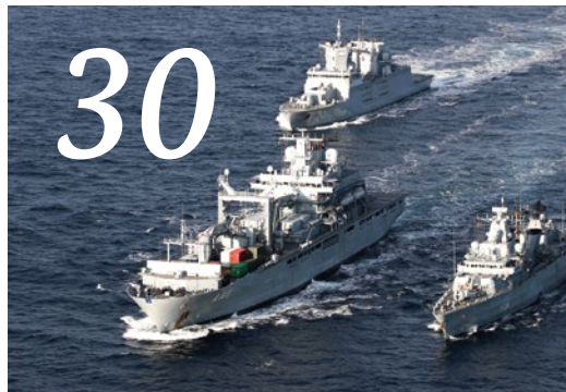
Wehrhaft: Frieden in Freiheit