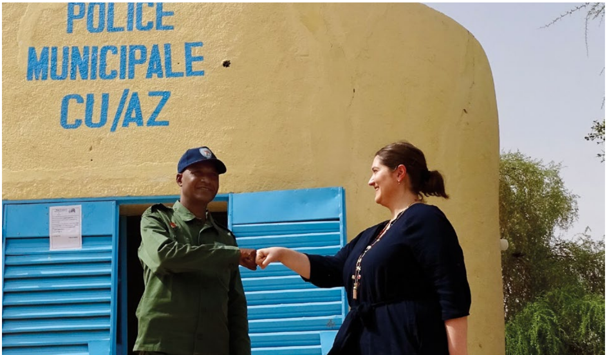
Deutschland entsendet ziviles und polizeiliches Personal in die Mission EUCAP Sahel Niger zur Unterstützung nigrischer Sicherheitskräfte bei der Bekämpfung von Drogen-, Waffen- und Menschenmuggel.

Anspruch der Bundesregierung ist es, in allen Phasen eines Konflikts politische Prozesse zu dessen Lösung zu fördern und mit Hilfe unserer Instrumente Anreize für Ausgleich und Versöhnung zu setzen. Dabei setzen wir zuvorderst auf Prävention, indem wir die strukturellen Ursachen von Konflikten angehen und friedensfördernde Akteure stärken. Die Bundesregierung übernimmt Verantwortung für internationales Krisenengagement im Rahmen ihrer Bündnisse und der internationalen Organisationen.