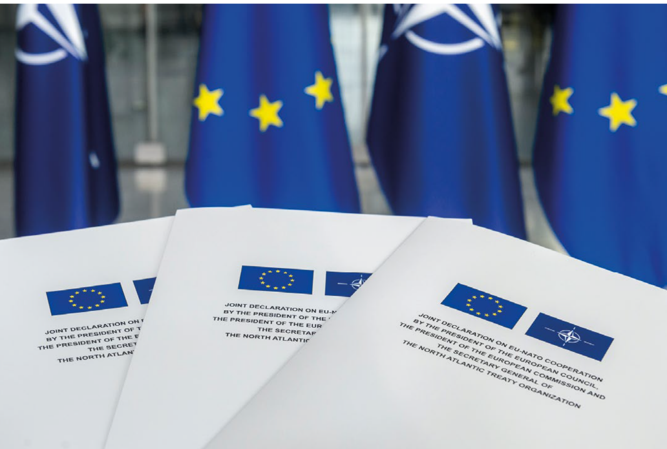
Gemeinsame Erklärung zur Zusammenarbeit zwischen der EU und der NATO