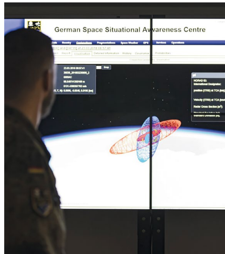
Vom Weltraumlagezentrum in Uedem aus schützt die Bundeswehr gemeinsam mit dem Deutschen Zentrum für Luft- und Raumfahrt zivile und militärische Systeme im Weltraum.

»Die Bundesregierung wird das Weltraumlagezentrum ausbauen. Um lageangemessen auf Vorfälle im Weltraum reagieren zu können,