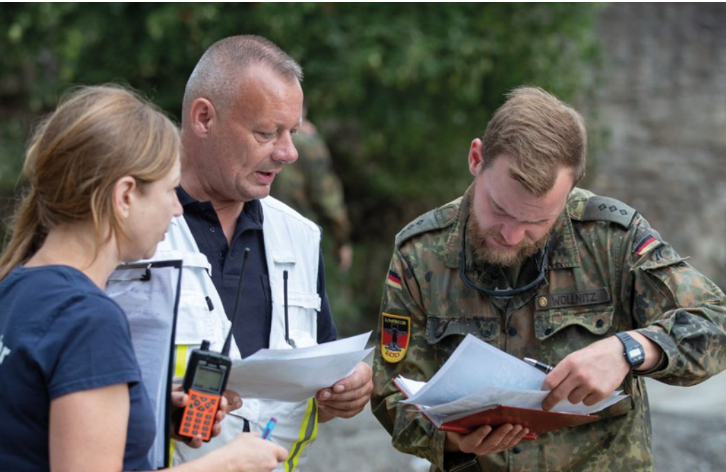
Die Bundeswehr unterstützt bei den Aufräumarbeiten nach der Hochwasserkatastrophe im Ahrtal.

»Die Bundesregierung wird ihre Cyber- und Weltraumfähigkeiten sowie ihre Weltraumlagefähigkeiten erweitern, damit diese einen wesentlichen Beitrag zu kollektiver Abschreckung und Verteidigung in der NATO leisten können.