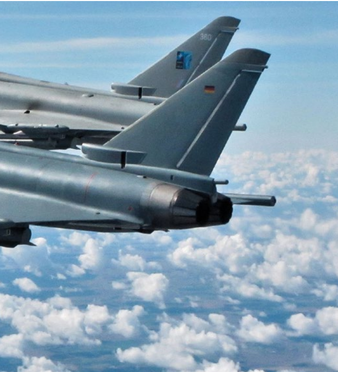
NATO-Luftraumüberwachung im Baltikum