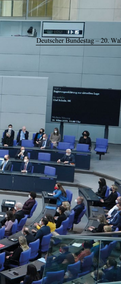
Debatte zur „Zeitenwende“: Plenarsitzung des Bundestags am 27.02.2022

nicht komplett verhindern, sondern nur noch eindämmen. Zugleich liegen große Chancen in einer nachhaltigen, grünen und sozial gerecht ausgestalteten Transformation, die nicht nur saubere Energie und gesicherte Ernährung, sondern auch weniger Abhängigkeiten bedeutet.