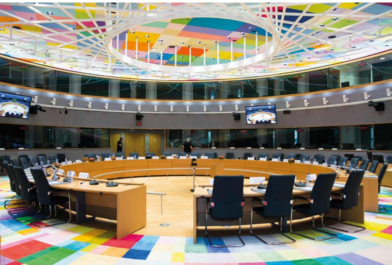
Sitzungssaal des Europäischen Rates in Brüssel